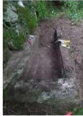
Travaux de curage en cours