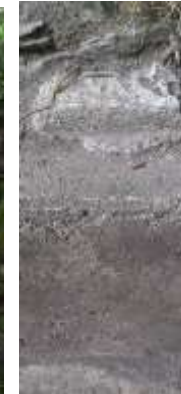
Petites cales en ciment