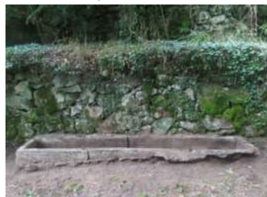
.... Aspect terminé .....