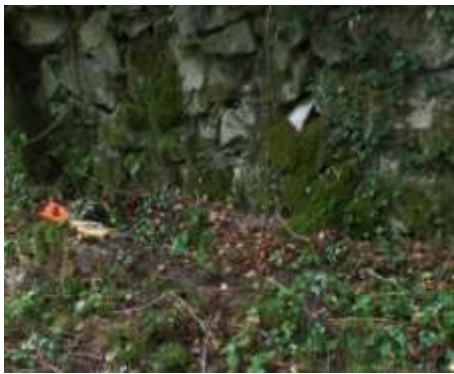
Aspect du vivier dissimulé sous la végétation

Avant les frigos et les congélateurs, Marcel conservait les truites qu'il avait pêchées dans ce grand vivier maçonné, proche d'un bras du valat de Dondigné. Il était recouvert d'un grillage pour protéger les poissons des prédateurs et pour les empêcher de sauter. Il est sûrement encore en état de fonctionnement, mais il avait disparu sous la végétation et les glissements de terre.