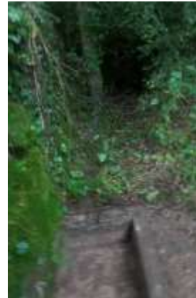
Le valat de Dondigné est au fond