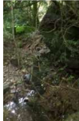
Valat de Dondigné au niveau de la prise d'eau