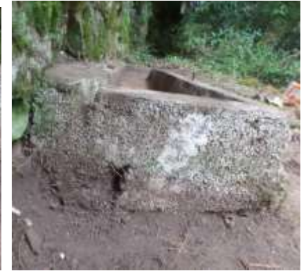
Trous de vidange et trop plein