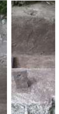
Attache de la grille