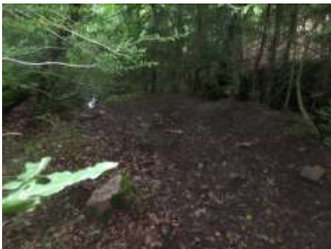
Emplacement (colmaté) de la citerne (suite) (Côté sud)