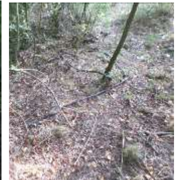
restes de nombreux tuyaux d'irrigation aux alentours de la citerne