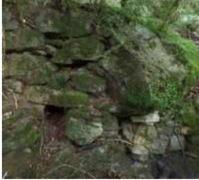
... Conduit, très bien conservé, pour la sortie de l'eau (h= 60 ; l =40 ; profondeur= 150 cm) ...