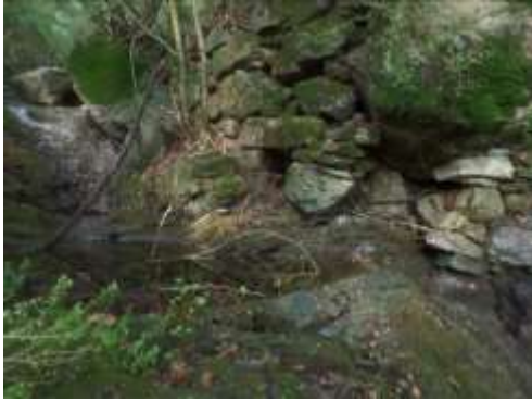
Mur de la citerne vu depuis le ruisseau (h = 1.8 m max.)

Selon Jean Claude MARTIN, cette ancienne citerne, aujourd'hui colmatée, d'un volume apparent d'au moins 20m 3 , était encore utilisée dans les années 1960. Pour envoyer l'eau vers les jardins, il fallait soulever une tige en bois faisant office de bouchon, localisée probablement à l'aplomb de l'extrémité du conduit très bien conservé, situé à sa base. Les parois de la citerne sont constituées de grosses pierres transportées naturellement par le bras du valat de Dondigné, reliées entre elles par un assemblage peu élaboré de pierres sèches plus petites. Les surfaces intérieures des parois devaient être tapissées d'argile pour assurer l'étanchéité.