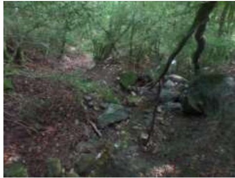
Béal pour alimenter la citerne (la citerne est au fond)