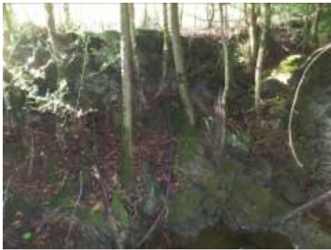
Murette à l'opposé de la sortie