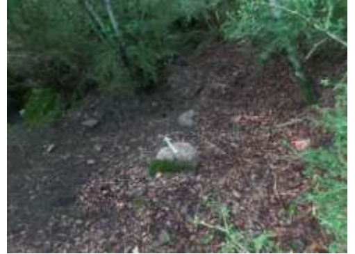
Emplacement (colmaté) de la citerne (+/-15 m 2 ) (Côté nord avec arrivée du béal d'alimentation en haut à droite)