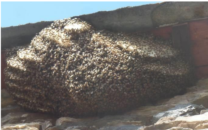
18/8/2019 Nid au sommet de son activité