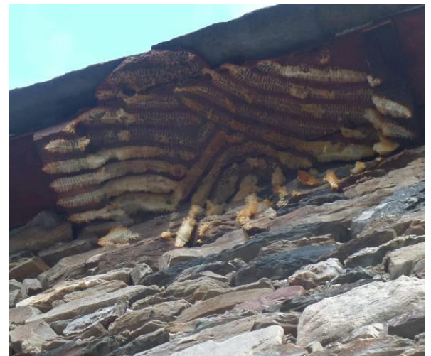
15/3/2020 – les alvéoles ont été coupées par une main inconsciente