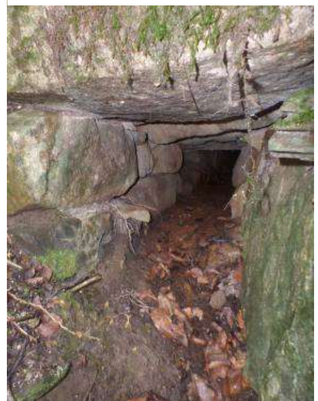
Conduit, très bien conservés.