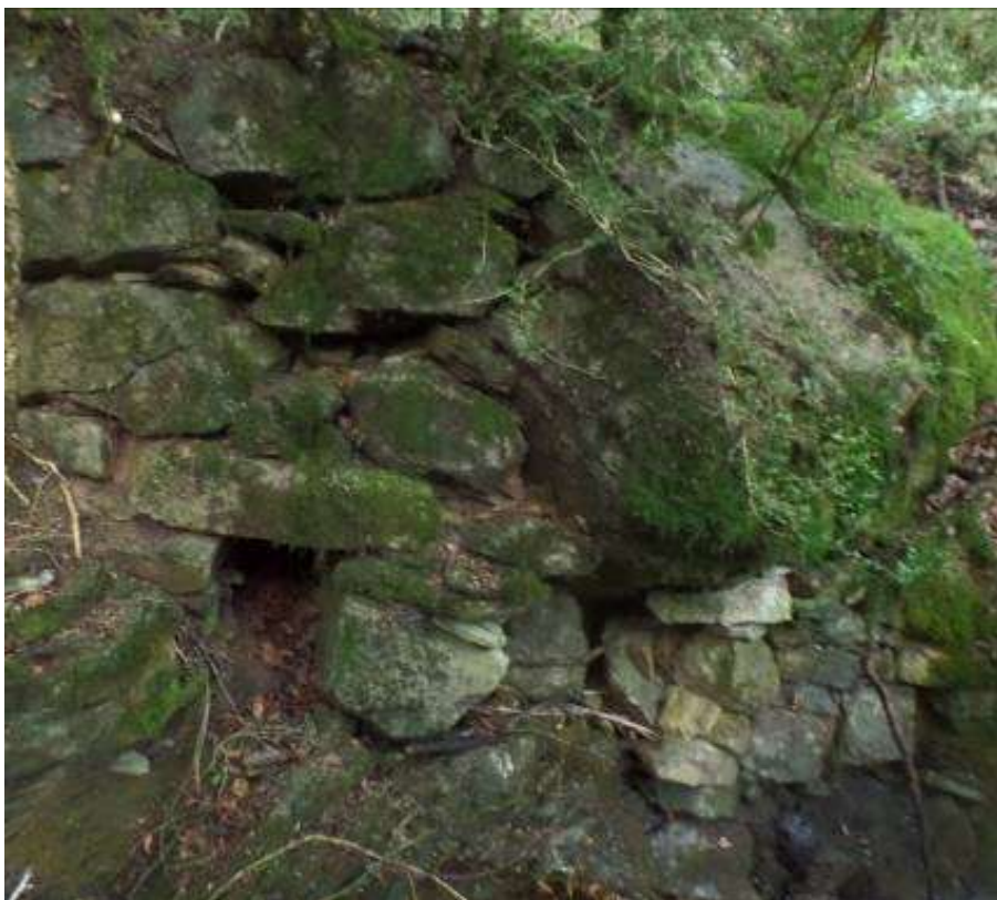
Mur de la citerne vu depuis le ruisseau